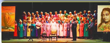
Ananda World Brotherhood Choir, California USA

Discepolo diretto del grande Maestro indiano Paramhansa Yogananda, ha vissuto e diffuso i suoi insegnamenti sulla realizzazione del Sé, fondando nove comunità spirituali in America, Europa e India, scrivendo oltre cento libri e più di quattrocento brani musicali vocali e strumentali.